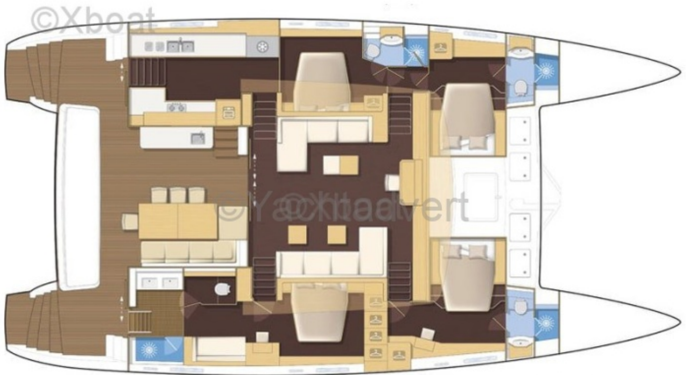
Cuisine latérale, 4 cabines / Lateral galley, 4 cabin version